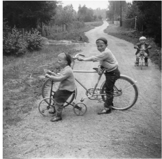
Svankärrsvägen mot sydväst från nr 32A. Närmaste korsning är Fasanvägen, därefter Rosenvägen. Foto omkring 1954.

Del av stadsplan från 1967. Huset är inritat mitt i texten "3581". De två V-na markerar kameravinklar för de två fotografierna.