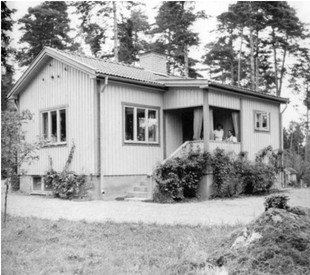
Ultuna 1:250, senare Sunnersta stadsäga 3581, kvarteret Moripan. Svankärrsvägen 32A, Uppsala. Foto omkring 1954.